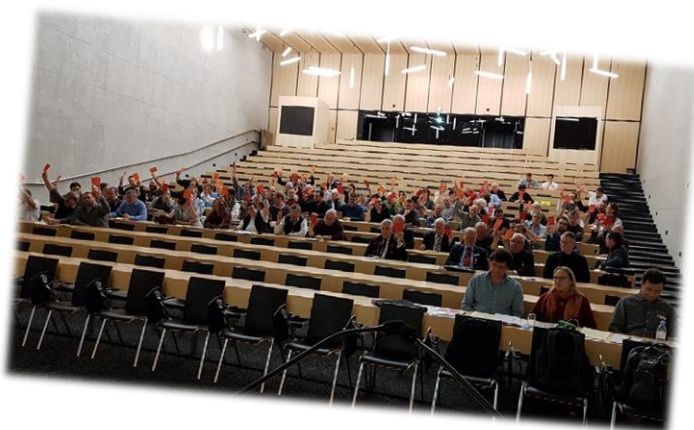
AD Sierre 2019

La prochaine assemblée des délégués se déroulera le 8 février 2020 à Cernier