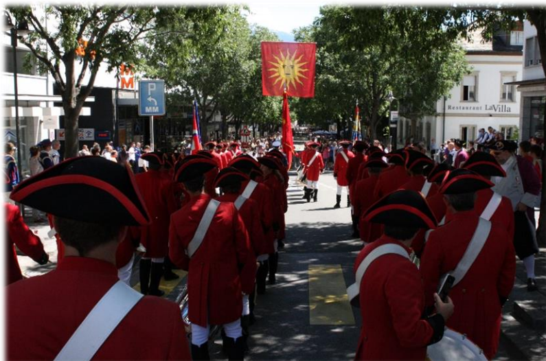
Défilé des sociétés le dimanche